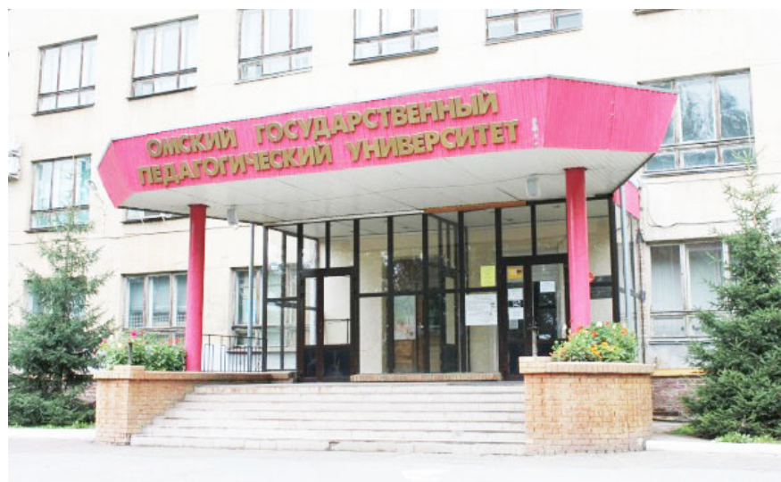
Омский государственный педагогический университет (1932-2016)

Уважаемые студенты, преподаватели и ветераны педагогического труда!