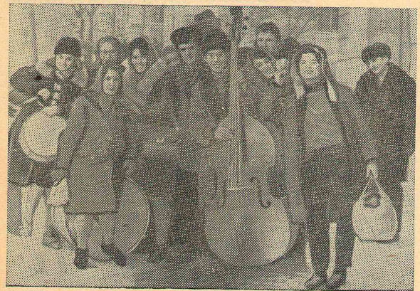
На снимке: агитбригада собирается в путь.

Об Омском народном хоре сказано и написано очень много. Что и говорить, его слава шагнула далеко за пределы нашей страны. И хочется еще и еще раз добавить, что песни и танцы наших земляков будят в человеке лучшие эстетические чувства, бесконечную любовь и гордость за свой край, за свою Родину с ее необычными просторами и неисчислимыми талантами. Об этом, во всяком случае, скажут всегда их поклонники и почитатели из Омского пединститута.