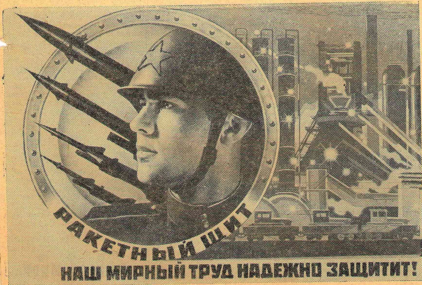
Плакаты художника В. Корецкого (издательство «Советский художник»)