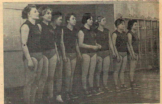
4. Вот они — наши победительницы из сборной волейбольной.