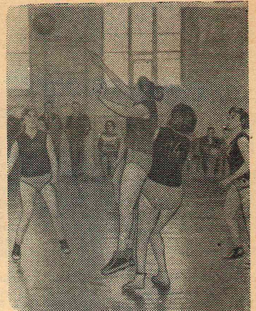
2. Пасс хорош! А какой получится нападающий удар?