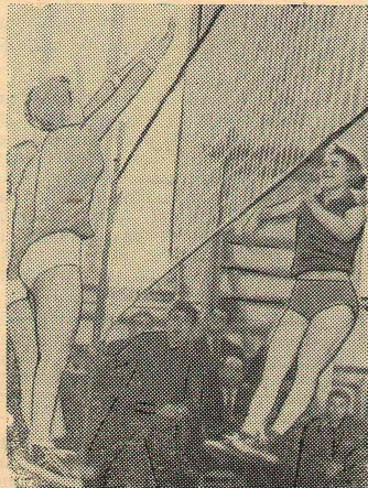
3. Отличный удар! Блок. Куда же дальше пойдет мяч?