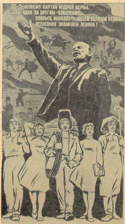
По-сыновнему партии мудрой верны, Шли — одно за другим — поколения... Славься, молодость нашей великой страны!

Осенняя знаменем Ленина! Плакат художника В. Назыркина. Стихи А. Филагова.