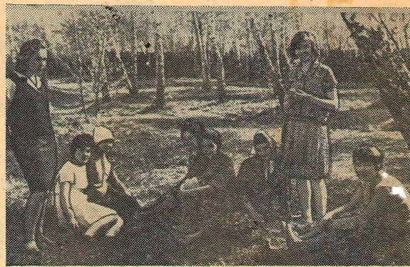
НА СНИМКЕ: студенты естественно-географического факультета обсуждают проведенный в школе урок...