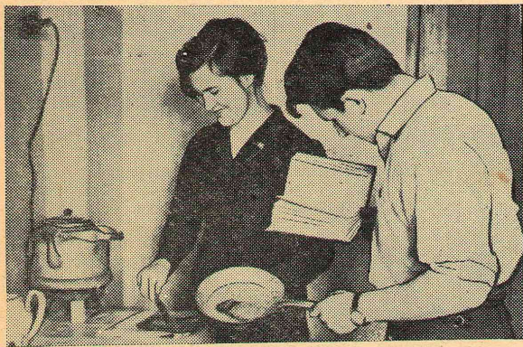
В дни подготовки к экзаменам книга — неразлучный спутник в любой обстановке. Даже вот в такой, какая изображена на этом снимке.