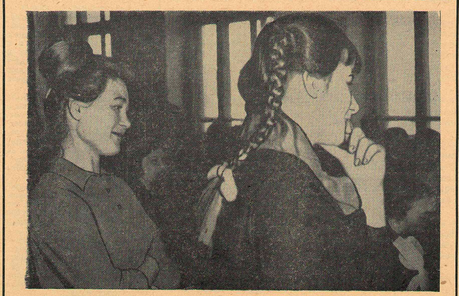
Формы пионерской работы разнообразны. В этом убедились студенты-математики и художники на практике минувшей весной. Это — проведение соборов, вечеров, походов. НА СНИМКЕ: Утренняя, посвященный 40-летию «Пионерской правды». Его организовали в 64-й школе г. Омска наши студенты.

по качеству и продолжительная по количеству курсов. Это единственная возможность стать через четыре года учителем. Иначе получается иногда так, что выпускники в институте, плюс три семестра впереди — это два с половиной года из четырех, во время которых он обучается в институте вообще. И вряд ли все или хотя бы часть этих проблем решит общественно-полезная практика, которая вновь вводится в втором курсе. В корне изменить существующее положение может только изменение программ с введением специальных курсов по инициации — школы. Вот и судите, как-то второкурснику, если в пединституте только и заботы о педагогике, а не о школе. А дальше получается чуть ли не трагедия. То, чему студент мог бы учиться на протяжении пяти семестров, ему приходится с невероятными трудностями преодолевать в один месяц (столько длится производственная практика на третьем курсе). Едва познав или вообще не познав тайн учительского труда, студент вновь покидает школу на семестр (до трехмесячной практики на 4-м курсе, которая часто проходит совсем в другой школе). Итак, четыре месяца педпрактики в школе за четыре года обучения в институте! Практика и еще раз практика, более высокая