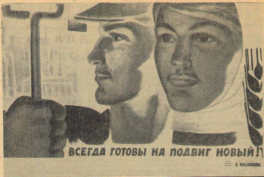
ВСЕГДА ГОТОВЫ НА ПОДВИГ НОВЫЙ!