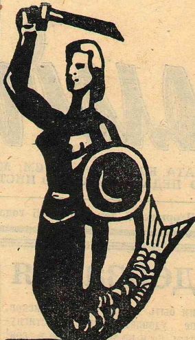
Сирена (русалка) — герб Варшавы.

Недалеко от Варшавы Желязова Воля — родина Фредерика Шопена. В доме, где родился композитор, музей. Усадьба и парк полностью сохранены. Здесь мы проводим половину следующего дня. Вечером в театре смотрим оперетту Целлера «Продавец птиц». Последний вечер в Варшаве проводим у обелиска Сирены.