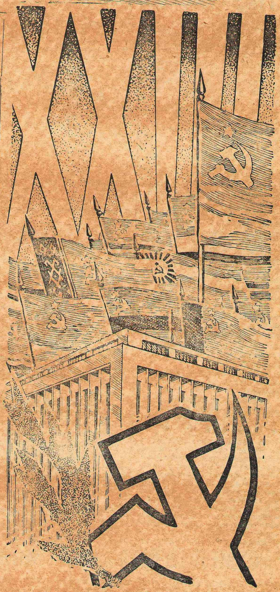
Плакат художника Р. Иванова.

Мы на пороге величайшего события в жизни Советского народа — открытия XXIII съезда Коммунистической партии Советского Союза. Накануне