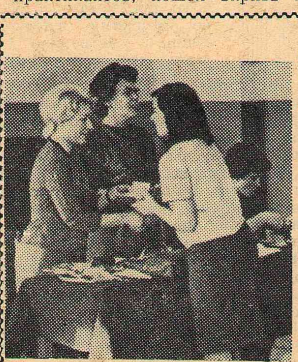
НА СНИМКЕ: вручение билетов членам гуманитарной секции научно-студенческого общества.

Эту простую, иногда горькую истину нам надоело познать на первом уроке, который, признаться, у большинства из нас, практикантов, пошел вкряк.