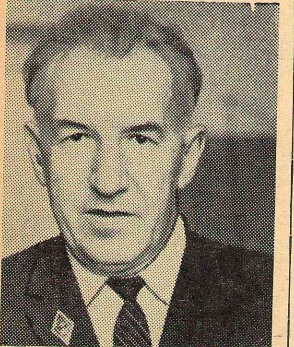
и преподавателей, рабочих и служащих института, которые одновременно с днем рождения