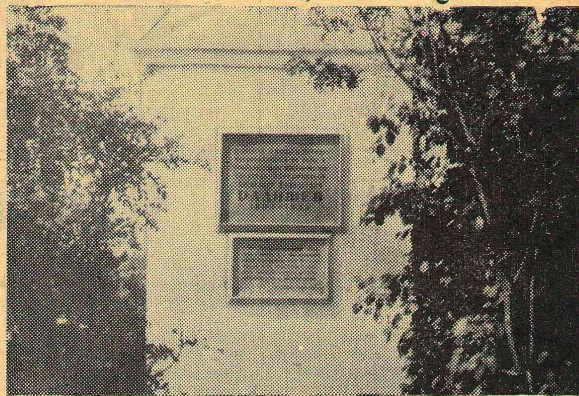
Мы побывали в тех местах, где проезжал Радищев.