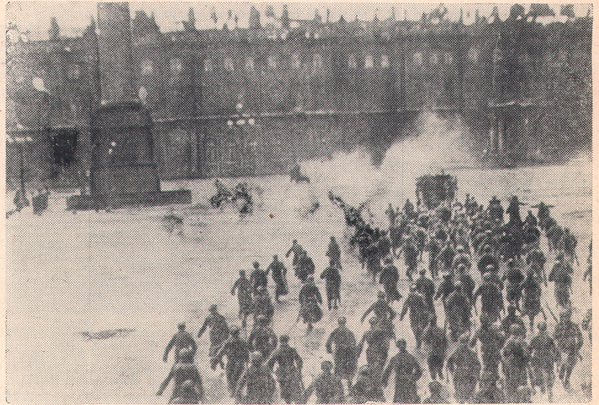
Петроград. 1917 год. Штурм Зимнего дворца.

Всесоюзный конкурс проводится в три тура. 1 тур в нашем институте уже начался. Городской смотр состоится в апреле и мае 1967 г.