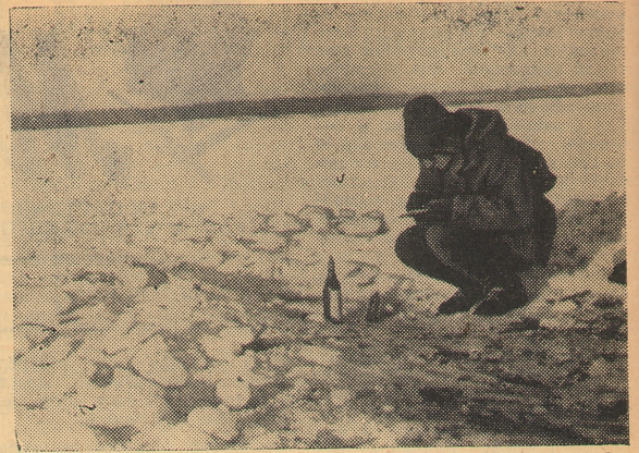
Для нас туризм не просто спорт, но и научный поиск.

Солнце упремо поднималось над хребтами. Д. ГУТЕНЕВ.