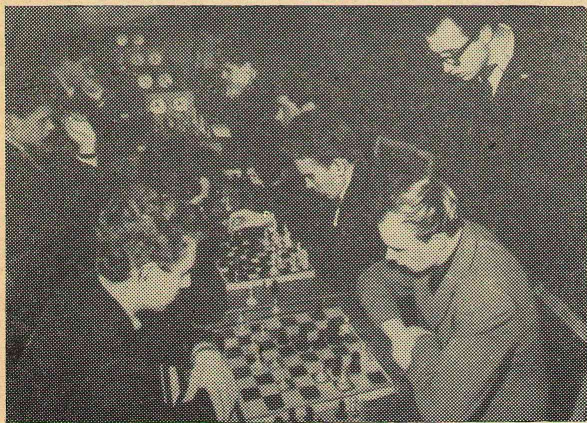
Шахматы — это постоянное напряжение мысли, это вдумчивость, огромная сосредоточенность. Побеждают те, кто владеет всеми этими качествами.