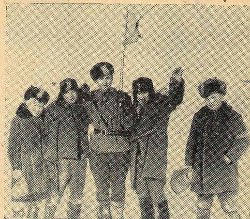
Фото 1. На безымянной высоте.