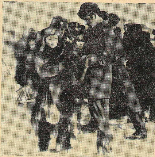
Фото 2. Ура! Материальная часть освоена.

Ю. РУДЬ, преподаватель литературы