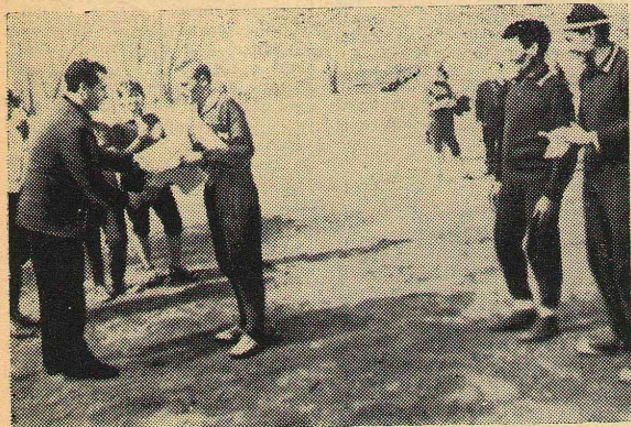
Пришла пора пожинать лавры.