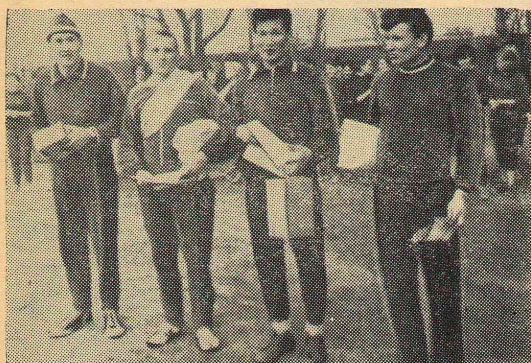
Вот они — победители!