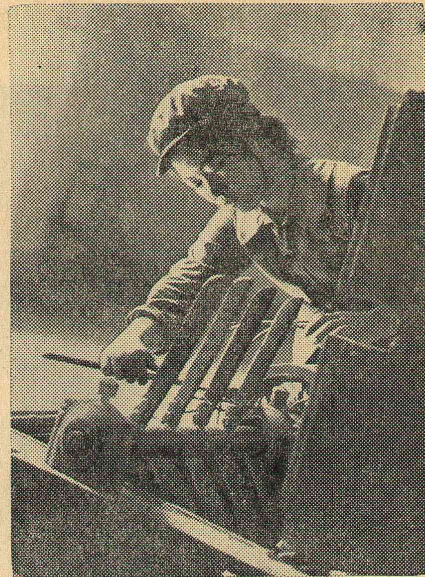
предложений, внедрение которых повысило производительность труда на 20 процентов. Работает на мир.

Этот снимок сделан на Хайфонском заводе сельскохозяйственного машиностроения. Только во втором квартале текущего года труженники завода внесли около 80 рационализаторских