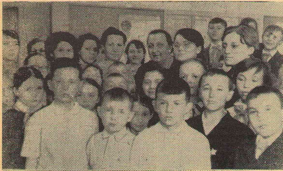
Студенты и преподаватели среди своих маленьких воспитанников.