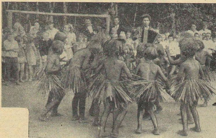
НА СНИМКЕ: лагерьный карнавал.