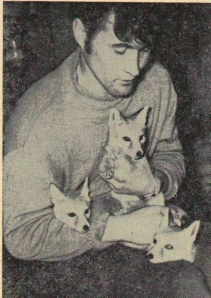
Лисята — питомцы студентов естественно-географического факультета.