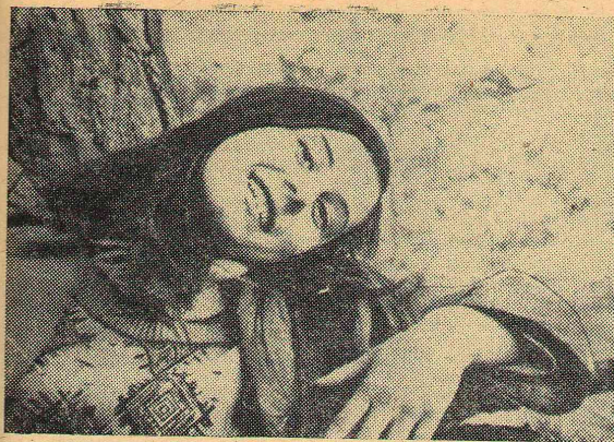
А у всех сессия...