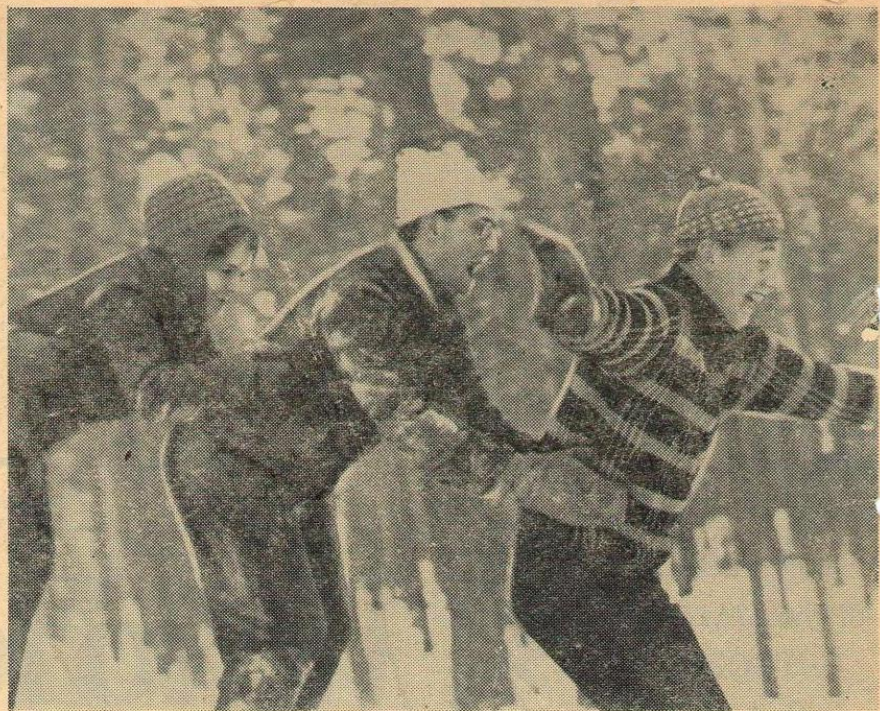
Это развлечение. А скоро будет работа, засучив рукава. На носу сессия.

Конференция приняла резолюцию «О современном моменте и задачах партии», в которой был дан анализ политической обстановки в стране после столыпинского переворота. Партии, прикрываясь лжеконституционными формами, шел по пути укрепления блока с черносотенными помещиками и верхами торгово-промышленной буржуазии. В резолюции был дан анализ позиций рабочего класса и крестьянства, излагались тактические задачи партии.