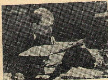
В. И. Ленин в президиуме IX съезда РКП(б) в Свердловском зале Кремля. Москва, март-апрель 1920 года.