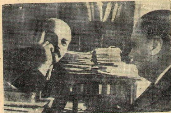
В. И. Ленин в своем кабинете в Кремле беседует с английским писателем Гербертом Уэллсом. Москва, октябрь 1920 года.