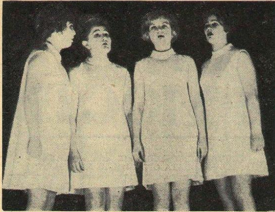
Ансамбль «Березка» естественно-географического факультета.