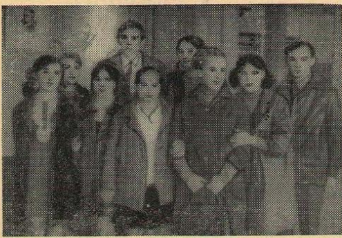
Десятиклассники Новосельской школы приехали вместе со своим классным руководителем.