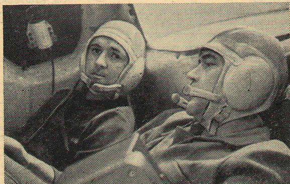
Командир космического корабля «Союз-9» А. Г. Николаев (на переднем плане) и бортинженер В. И. Севастьянов на тренировках.