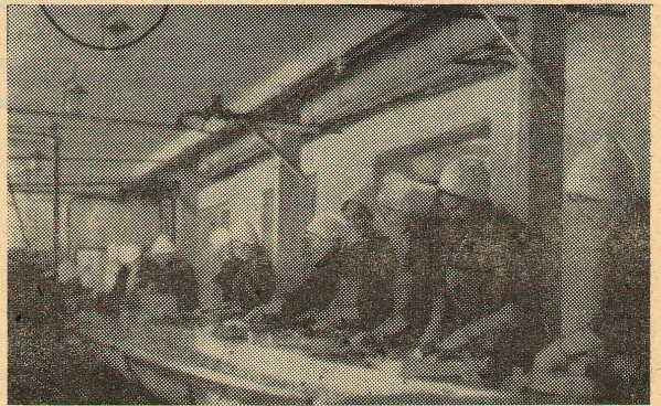
На самой большой кухне страны.