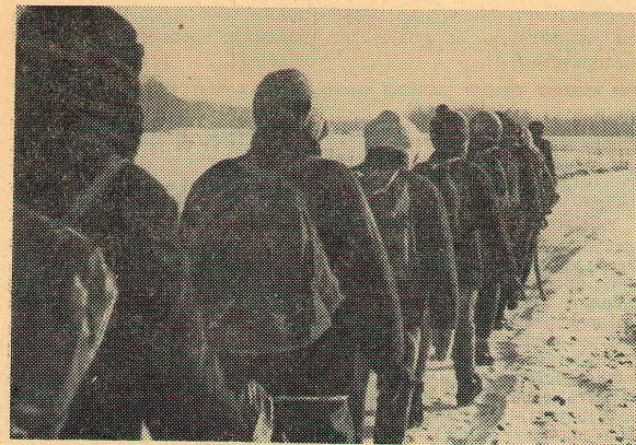
Ходили мы походами...