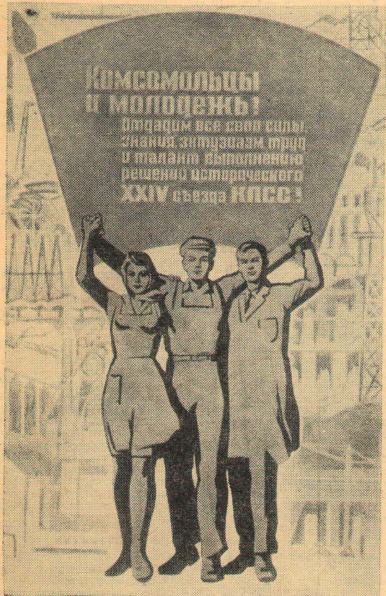
Плакат художника Е. Соколова.

В следующем номере «Молодость» опубликует обязательства, принятые коллективом института на производственном собрании, а в дальнейшем на своих страницах будет освещать ход социалистического соревнования и выполнения принятых обязательств.