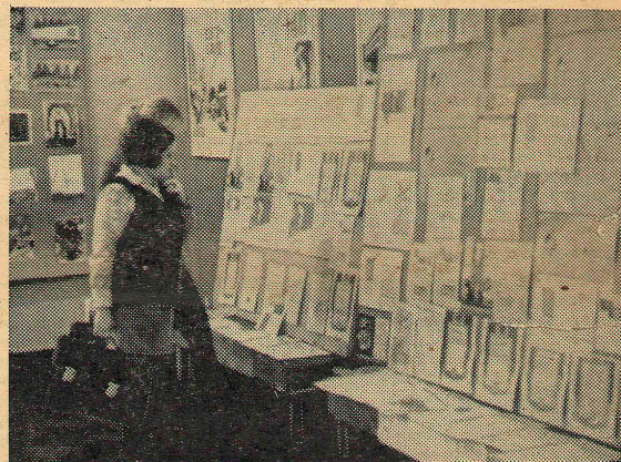
Выставка в фойе: лето прожито не зря!

натура, немного черства и сама скромность».