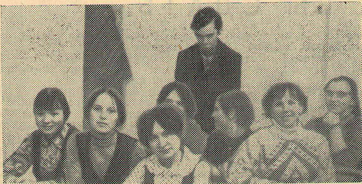
Математики в подшефной школе.

мое главное. «В заявке была просьба дать нам автобус на два дня: 18 декабря — субботу, и 19 декабря — воскресенье». Совершенно правильная просьба, ибо за один вечер ничего не сделаешь. «Заявка была утверждена, а о том, на сколько нам дают автобус, ничего не говорилось». Вполне понятно, что математики на два дня и рассчитывали. «Но шофер поломал нам все планы. Он сказал, что поедем домой сегодня же, то есть 18 декабря. Уговоры не помогли, тов. Елкин сказал, что машину нельзя оставить на открытом воздухе: она замерзнет и ее нельзя будет разогреть утром. От нашей помощи и помощи местного населения — шоферов — он отказался. Приехав в Белоусовку в 6 вечера, шофер сказал, что в 9 часов поедем обратно». «Что можно сделать за три часа?» — спрашивают математики. Действительно ничего. Ни нормального ужина, ни полноценных концерта и беседы, ни, тем более, отдыха. С трудом собрали человек 30 учащихся. «Вечер прошел скромно, полностью план поездки не был выполнен. Все это время шофер подгонял нас и не хотел оставаться, выдвигал всякие причины, почему ему надо быть в Омске сегодня. В 9 часов вечера мы выехали из Белоусовки. В 12 час. 30 мин. мы приехали в институт. Нас высадили из авто-