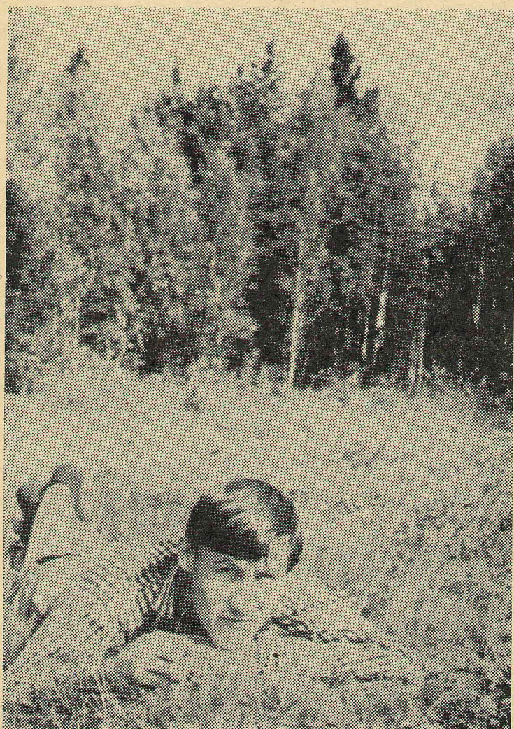
ВОСПОМИНАНИЕ О ЛЕТЕ.