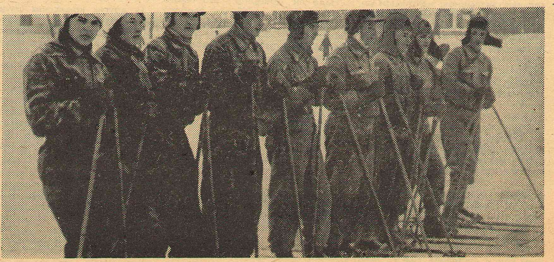
В строю — участники многодневного лыжного похода. Так начинался туризм в нашем институте.