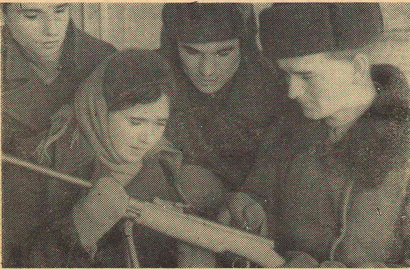
1936 год. Военное дело — каждому студенту.

Все наши комсомольцы активно занимались не только спортом, но и военным делом. При военной кафедре работал пулеметный кружок, проводились занятия по материальной части парашюта. Многие студенты потом совершили прыжки, некоторые в дальнейшем служили в десантных войсках.