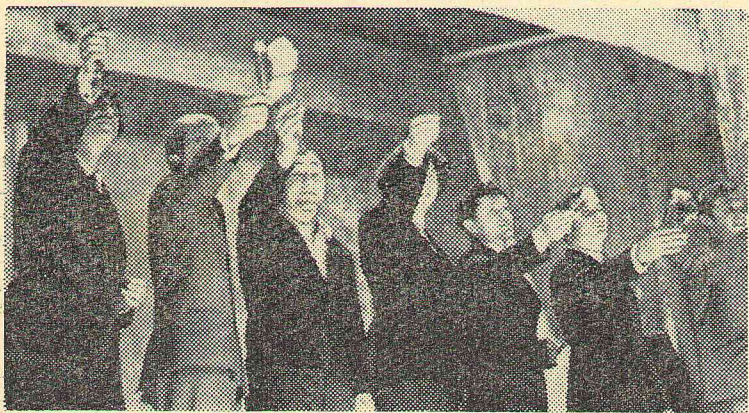
«И все же декан остается деканом!»

— Вам повезло! Ведь для того, чтобы учиться у нас, вам не нужно знать, в каком веке Пруссия напала на Африку, сколько спряжений имеет глагол «нейтрализовывать», не нужно помнить, что такое инфузория в туфельке, и еще многое другое. У нас от вас потребуются совсем немного: вы должны знать, что такое accommodation глаза и линейный гармонический осциллятор, в чем сходство и различие между бегущими, звуковыми когерентными, продольными, поперечными и прочими волнами. Вы