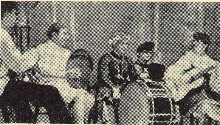
Любимцы публики — ансамбль универсалов «Колокольчик».

1. Посвящение было очень веселое; в нем чувствовалось, что посвящают и посвящаются физики. Все было оригинально и неповторимо.