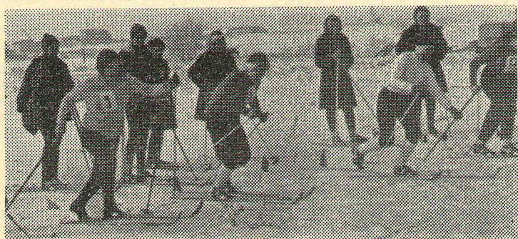
Женская эстафета 4×3 км. Старт первого этапа.