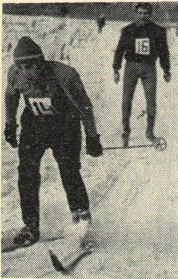
Лыжная гонка юношей на

Сегодня мы начинаем публиковать отчеты по зимним видам спорта. О коньках мы сообщим в следующем номере газеты.