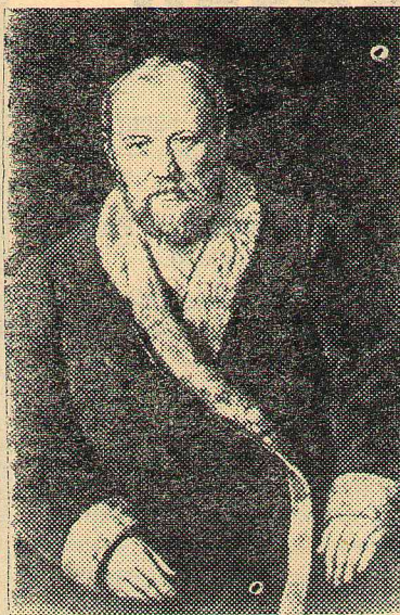
На верхнем снимке: А. Н. Островский.

Пьесы Островского составляют целый народный театр. Островский окончательно утвердил на русской сцене самобытную по своему содержанию и форме национальную драматургию, создал высокохудожественный репертуар для русского театра. Его работа в качестве ведущего драматурга, выдающегося общественного деятеля, основного организатора Московского артистического кружка и Общества русских драматических писателей и композиторов, прекрасного режиссера своих пьес и замечательного теоретика сценического искусства подготовила полную победу принципов реализма в области театра, осуществ-