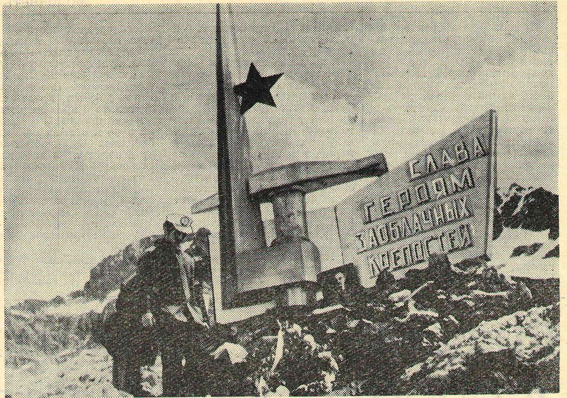
ЗДЕСЬ ВЕРШИЛАСЬ ПОБЕДА! У обелиска защитникам Клухорского перевала. Кавказ.

Пусть же этот день станет днем окончательной победы всех миролюбивых сил на земле.