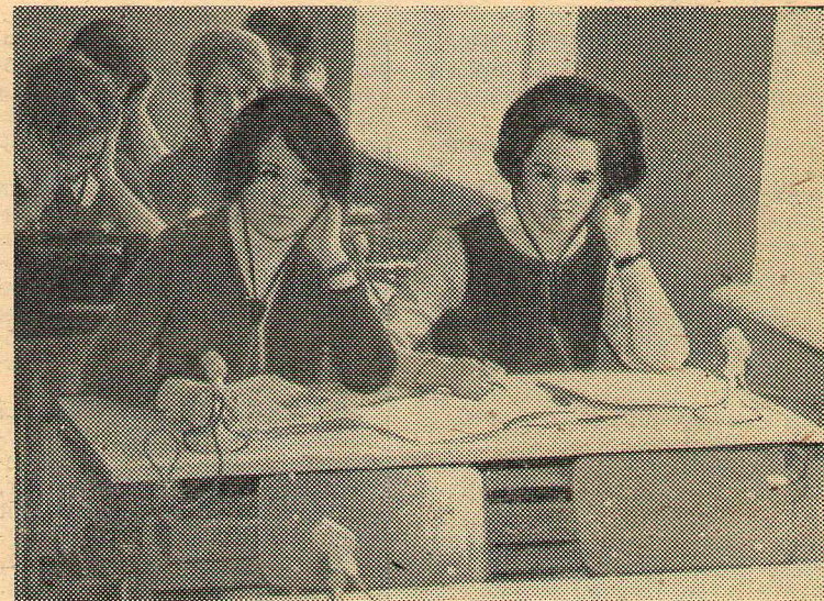
Работа долгая, кропотливая.

Прочитала она это объявление, и ей показалось оно чем-то обидным. Да так она обиделась, что даже перестала разговаривать. Чем оно было обидным, не знаю до сих пор.