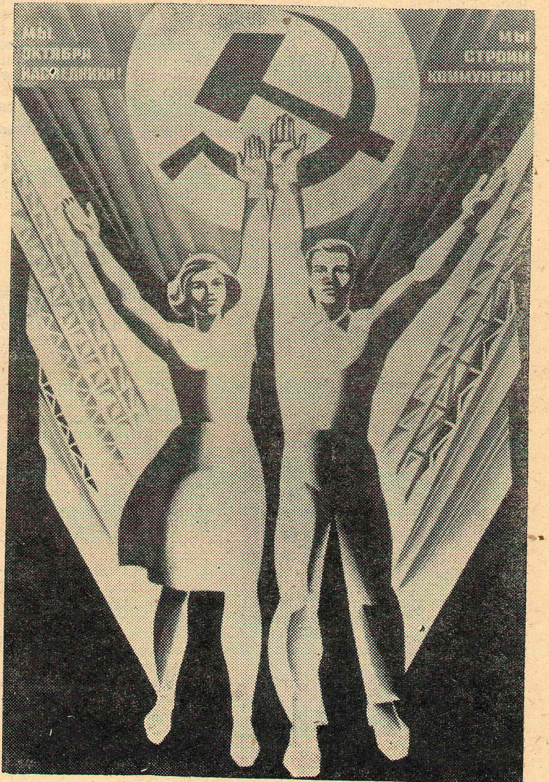
Плакат художника В. Механтьева (издательство «Изобразительное искусство»).