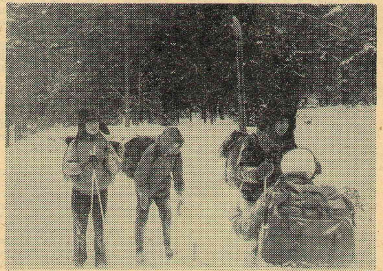
«Ну, так что вам, рассказать о зиме? То она как серебро, то как мел...»