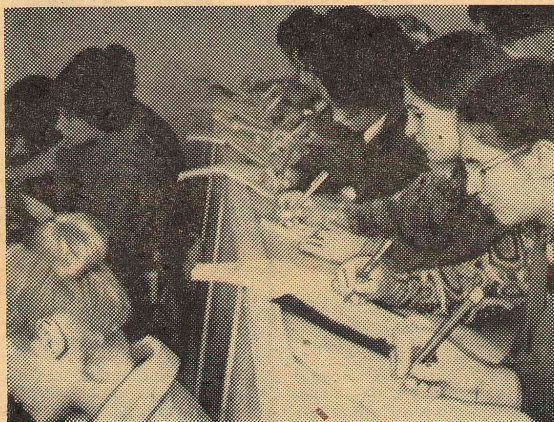
Четвертый курс матфака на лекции по научным основам школьного курса математики.