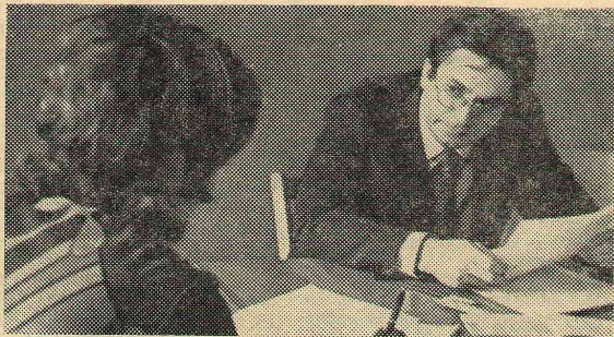
Экзамен по советской литературе у четвертого курса филологов. И совсем скоро — государственные.