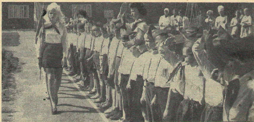
Пионерский лагерь «Буревестник», 3 сезон.

Много нужно знать и уметь, чтобы завоевать симпатии