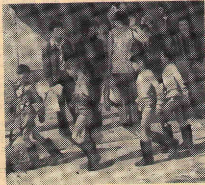
На парад идут пионеры — юные борцы (Улан-Батор).