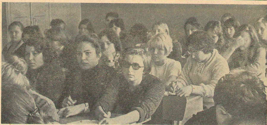
Первокурсники на лекции.

Сейчас мы второкурсники и, конечно, можем уже рассказать кое-что о нашем факультете. На первом курсе нас сразу захватила студенческая жизнь с ее увлекательными