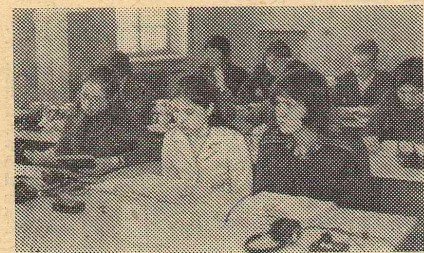
В лингафонном кабинете.

Многообразна и разносторонняя работа наших студентов, обучающихся по 4-м специальностям широкого профиля.