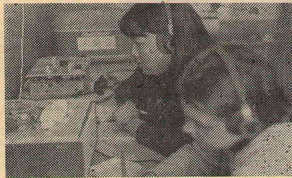
На индивидуальных занятиях.