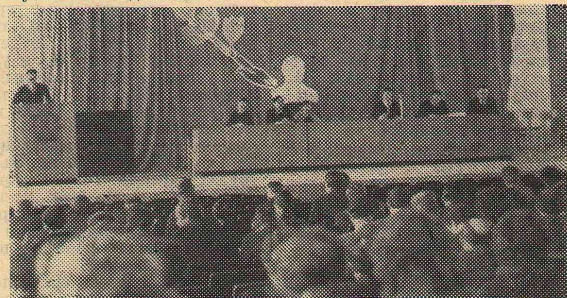
Идет обсуждение материалов съезда.

Открытые партийные собрания педком и полностью одобрили политическую линию и практическую деятельность ЦК КПСС и приваля к неуклонному исполнению выводов и задач, поставленных XXV съездом КПСС перед партией и народом на очередную 10-ю пятилетку.