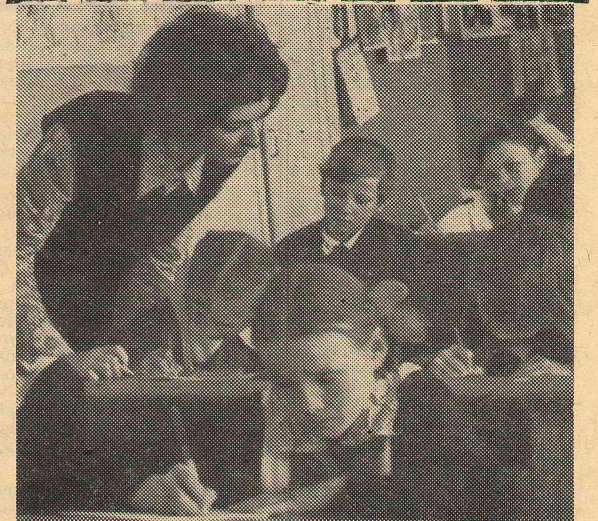
Буква за буквой — мир слова