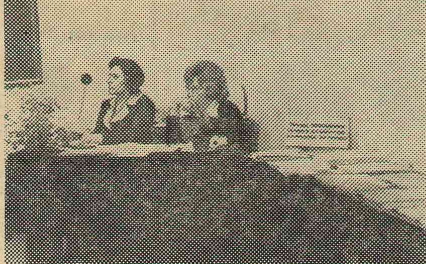
Выставка трудов преподавателей и студентов (секция ботаники).