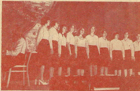
Вокальный ансамбль педфака.

Для выпускников прозвучали традиционные последние звонки.