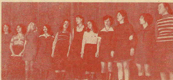
42-я группа поет «Гимн филологов» в честь преподавателей (Последний звонок).

Во Всесоюзном комсомольском собрании участвовало 2680 человек. Обсудили материалы XXV съезда, наметили конкретные меры по выполнению решений съезда, вклю-